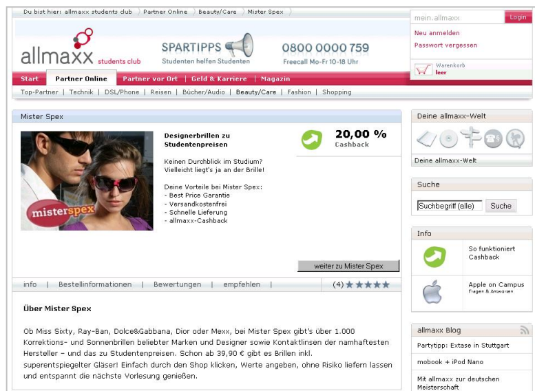
Shop-Produkt aus allmaxx.de